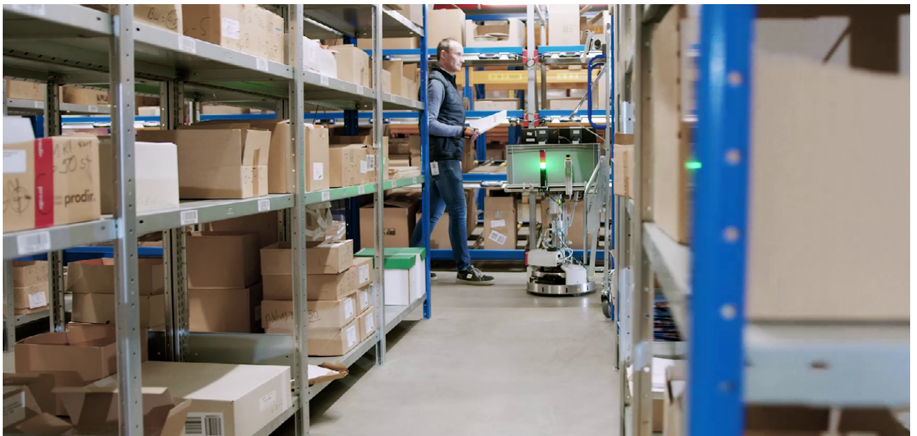
Ein Autonomer Mobiler Roboter (AMR) zur Unterstützung in der Kommissionierung ( https://www.xito.one/why-xito/story-teva.html ).