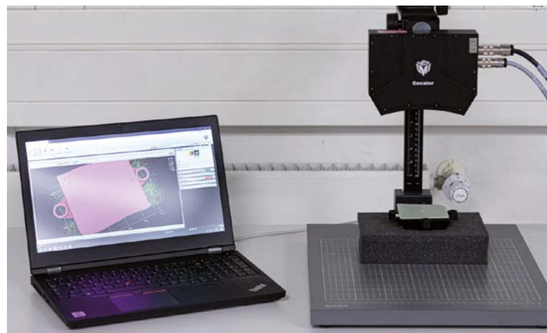
Bild 1: 3D-Messung von Bauteilen mithilfe von Streifenprojektion.

Für die Messung der einzelnen Bauteile wird beispielsweise das in Bild 1 gezeigte Streifenprojektionsmesssystem verwendet, welches innerhalb weniger Sekunden Messdaten mit mehreren Hunderttausend einzelnen Messpunkten erfasst.